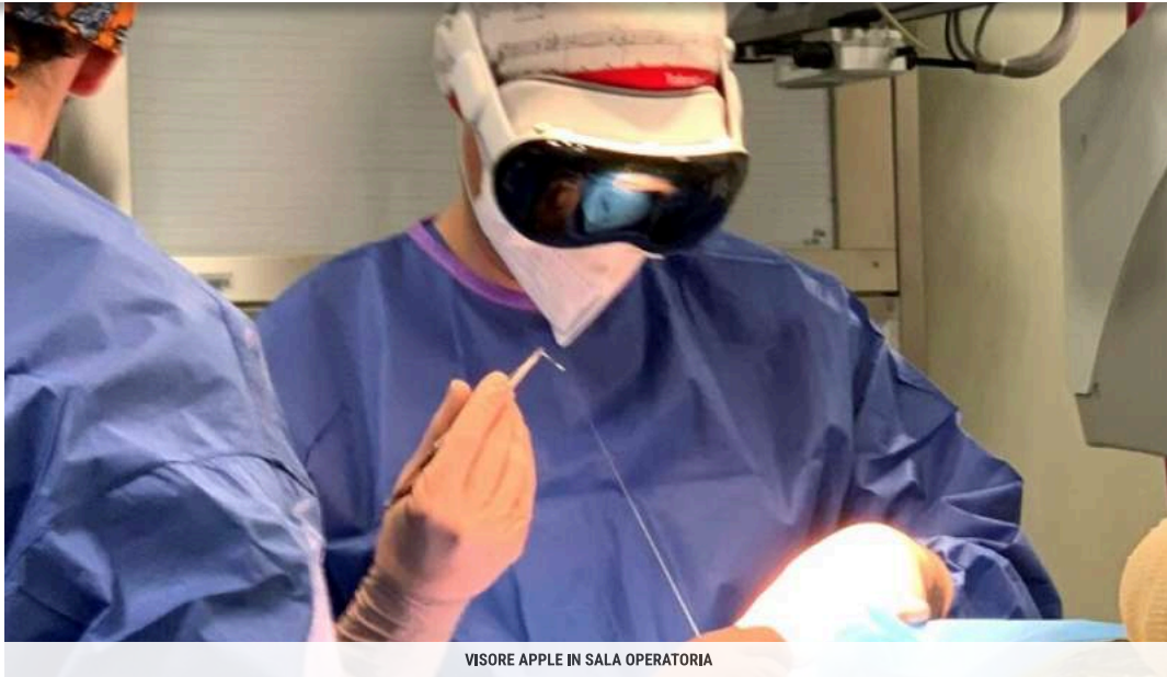
VISORE APPLE IN SALA OPERATORIA