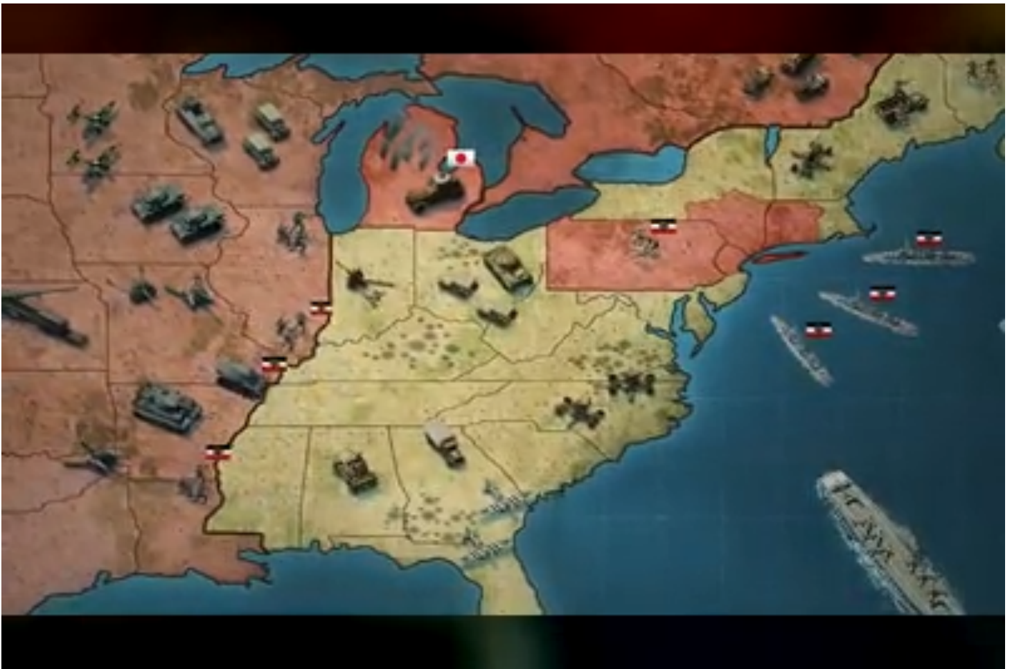
Military strategy game criticized for being 'too realistic'