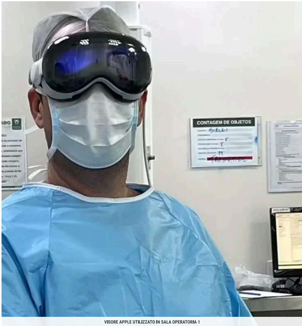
VISORE APPLE UTILIZZATO IN SALA OPERATORIA 1

Tra i vantaggi della nuova tecnica il Policlinico di Catania cita: la capacità di registrare l'intervento, aiutare didattica e collaborazione tra chirurghi a distanza e la possibilità agli studenti di medicina di osservare gli interventi da una prospettiva in prima persona. Infine è resa possibile la collaborazione in tempo reale tra chirurghi con videochiamate e la condivisione dello stesso campo visivo per un'eventuale consulenza e una guida durante gli interventi chirurgici maggiormente complessi.