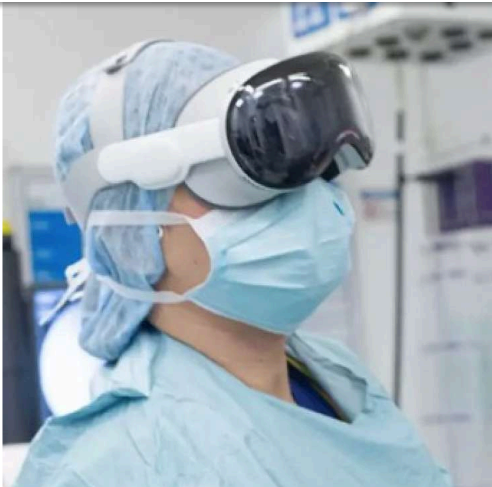
VISORE APPLE UTILIZZATO IN SALA OPERATORIA

Gli interventi, scelti appositamente tra quelli di routine