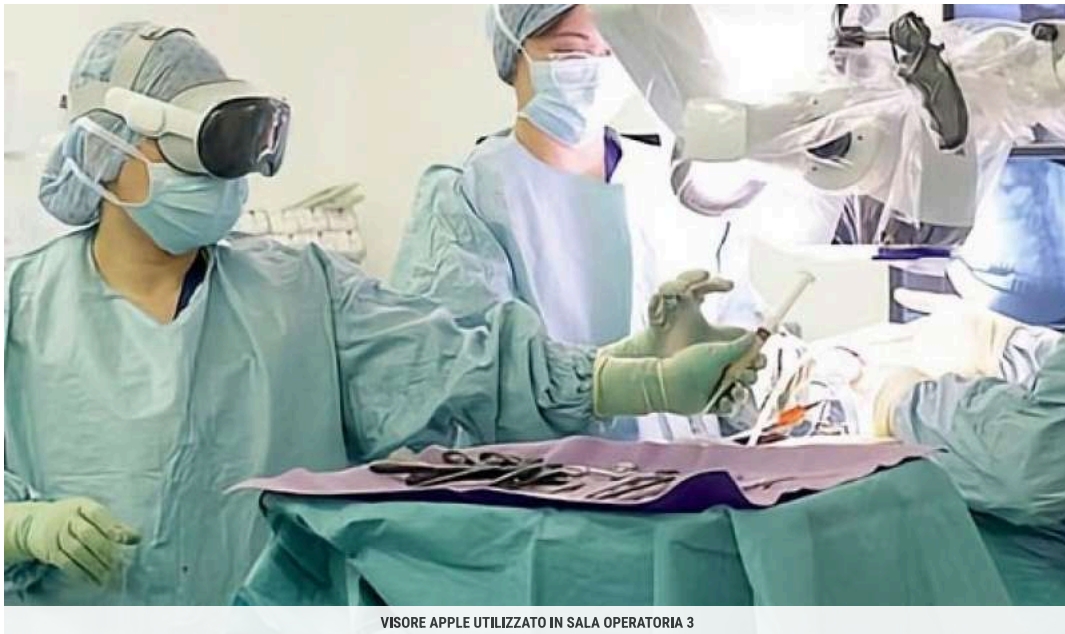
VISORE APPLE UTILIZZATO IN SALA OPERATORIA 3

(ANSA) - Un intervento di oftalmoplastica con l'utilizzo del visore commerciale Apple Vision Pro è stato eseguito al Policlinico di Catania. Lo rende noto l'azienda ospedaliera universitaria sottolineando che è stata "la prima seduta al mondo realizzata con l'ausilio di questo dispositivo all'avanguardia non ancora commercializzato in Europa", che "offre notevoli benefici di carattere sanitario oltre che economico".