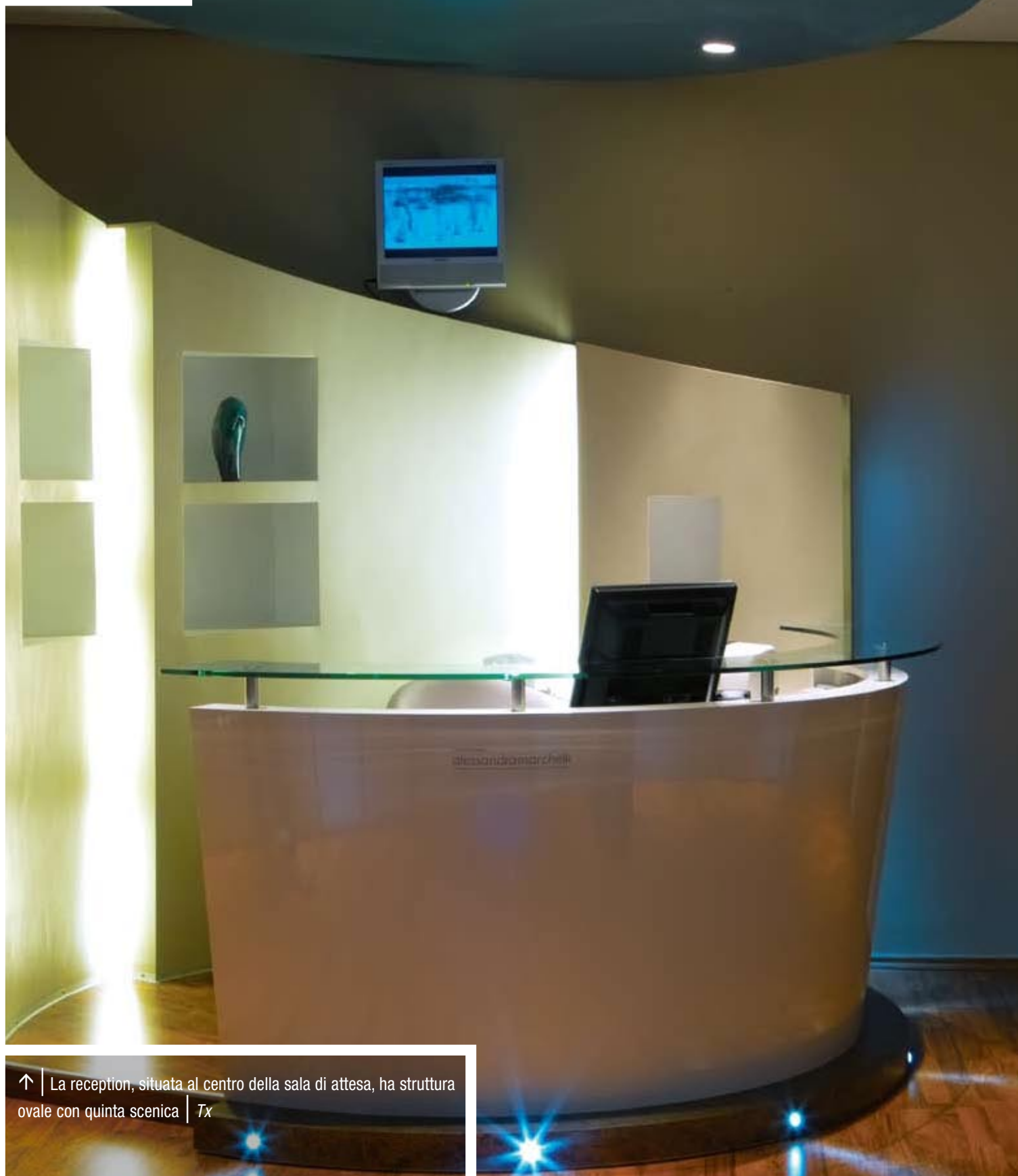
↑ La reception, situata al centro della sala di attesa, ha struttura ovale con quinta scenica | Tx